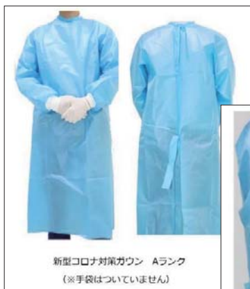
新型コロナウイルス対策ガウン Aランク (※手袋はついていません)