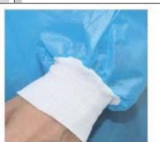
袖の形状 ストレッチの黒材 隙間が出ないようにしています