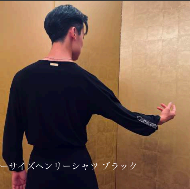
BM-02 オーバーサイズヘンリーシャツ ブラック ¥12,000