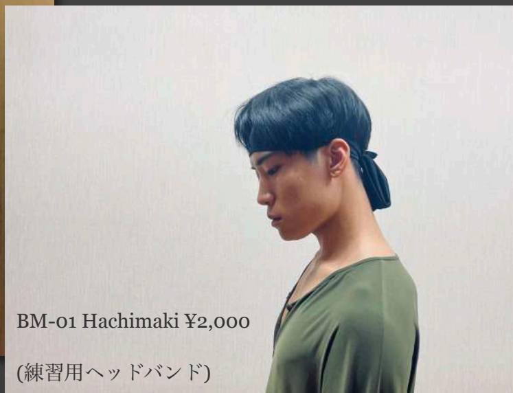
BM-01 Hachimaki ¥2,000 (練習用ヘッドバンド)