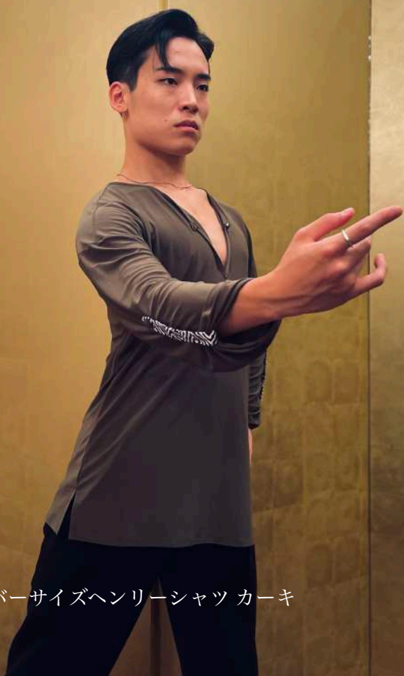
BM-03 オーバーサイズヘンリーシャツ カーキ ¥12,000