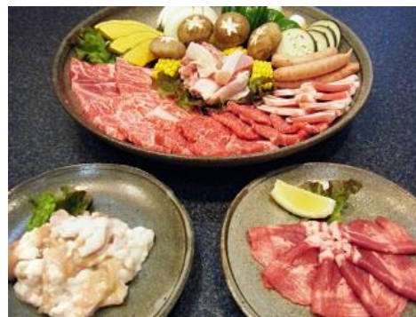
【ファミリーセット】

(タン・ホルモン・ロース・カルビ・美湯豚カルビ・若鶏もも・ウィンナー・焼き野菜・キムチ・ごはん・デザート)