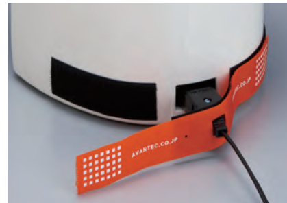
マグネットプラグ+保温ポット magnet plug+jug