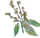
らくよう 洛陽染め

化学染料を一切使用せず、地球上のさまざまな地層から有害物質を含まない色鮮やかな色彩の鉱物や岩石を厳選し、不純物を取り除いた後、抹茶を引く茶臼などローテク技術によって超微粒子に粉碎。さらに精製された染料で色づけされます。人にも地球にも無害な染色方法です。