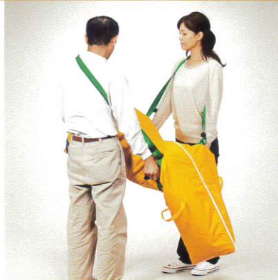
2人で左右で担ぐ場合

緑色のジョイントベルトをそれぞれが肩に掛け、上下の青い取っ手で持ち上げて搬送します。