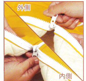
便利なファスナー