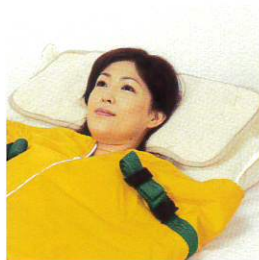
頭部を保護するために

内蔵した3次元立体編物(3D)がクッションになり頭部を守ります。取り外し可能なので、この部分だけはずして洗濯できます。