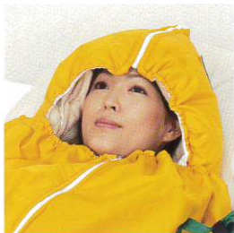
寒さを防ぐために