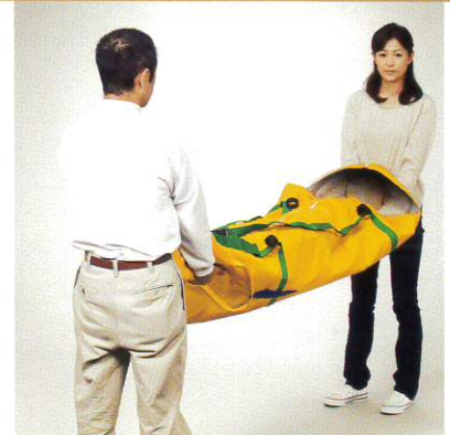
2人で前後で担ぐ場合

緑色のジョイントベルトをそれぞれが肩に掛け、上下の青い取っ手で持ち上げて搬送します。