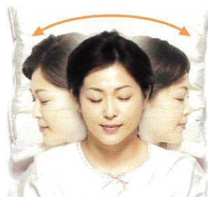
寝返りもらくらく

首の当たる周りに縫い目を入れて凹凸が出るように加工、首にフィットするように工夫しています。